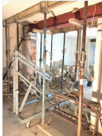
Einbau Stahlträger und Verkeilung