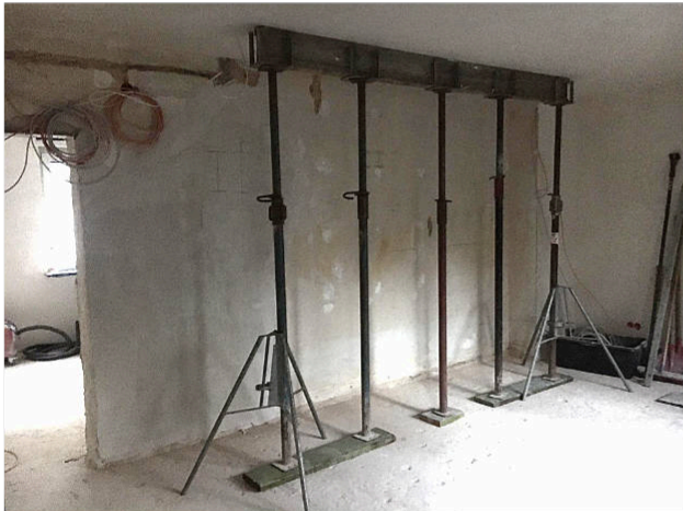
Notabstützung beidseitig der KG & EG Decken